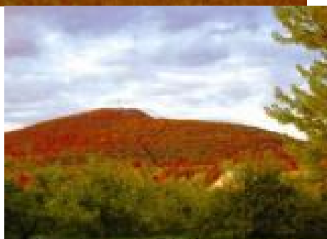
Photo de la tour de radio sur le Pic de la Dix terres à Rougemont Photo de la tour de radio sur le Pic de la Dix terres à Rougemont